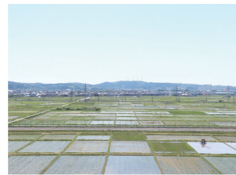
婦人科の病室がある6階は見晴らしが良く、晴れた日には鳥海山が見えることも

長い間、秋田大学医学部附属病院で婦人科がんの手術、治療に携わってきましたが、縁あって当院に勤務することになり、節目の10年を迎えました。当院でも多くのがん治療に携わることができ、とてもうれしく思っています。私が医師として最も大切だと考えていることは、患者さんやご家族との信頼関係です。専門用語を使わず、説明をつくすことをモットーとしています。また、治療の選択肢には順位を付け、それぞれを選んだ場合のメリット、デメリットを理解してもらおうようにしています。一般外来では十分説明時間が取れないような大事な局面には、午後に説明のための外来枠を設けています。