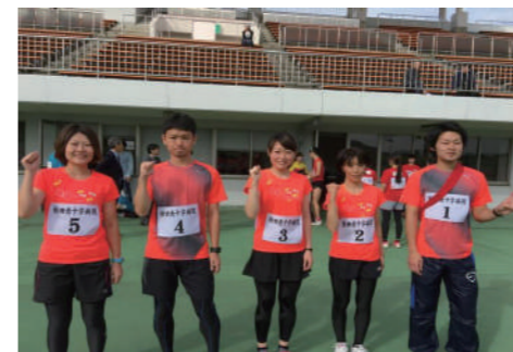
第16回 全国赤十字病(産)院スポーツ大会(長崎市)

ビアパーティー、ボウリング大会、忘年会など、楽しいイベントを開催しています。大いに盛り上がり、日頃の疲れを吹き飛ばしています。