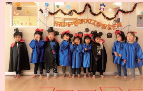
行事の様子(ハロウィン)