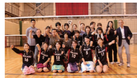
東北ブロック赤十字病院球技大会

院友会親睦旅行補助を申請する予定で同期と旅行の計画をたてました! そのおかげで食事やお土産選びなど、いつもより楽しく過ごすことができました。今年の夏休みを今から楽しみにしています。